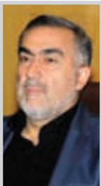
این روزها صد ها تن صیفی جات وارد میادین میوه و تره بار استان شده است

مطلب به خبرنگار ما گفت: با توجه به این که پتروفرهنگ یکی از سهامداران پتروشیمی خراسان، در زمینه تأمین خوراک، مقاومت می کرد، طی جلسه ای با وزارت صنایع