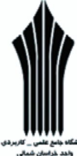
دانشگاه جامع علمی کاربردی واحد خراسان شمالی