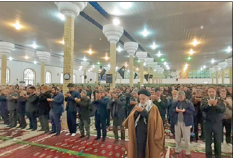
آیین عبادی، سیاسی نمازجمعه روز گذشته در فاروج

عوض زاده- امام جمعه موقت شیروان اظهار کرد: شهید «سلیمانی» عامل وحدت دو ملت ایران و عراق بود.حجت الاسلام «عزیزی» با اشاره به عملیات سپاه و حمله موشکی به پایگاه آمریکایی «عین الاسد» از آن به عنوان سبیلی اول انتقام یاد و تصریح کرد: این عملیات، قدرت ایران را به دنیا و آمریکای جانیکار نشان داد.