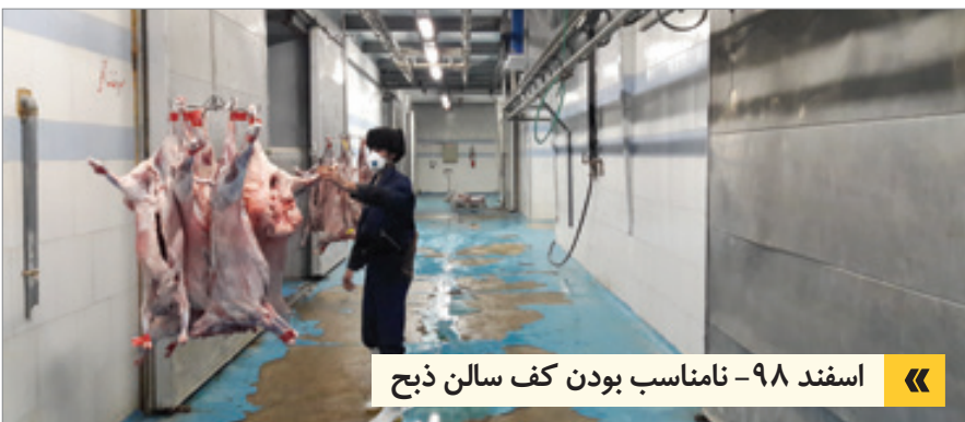
« اسفند ۹۸- نامناسب بودن کف سالن دیخ