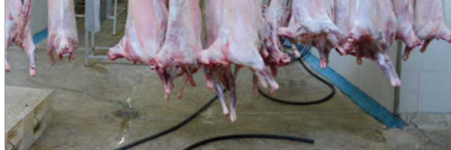
« مرداد ۹۹- اصلاح خروجی آب کف سالن