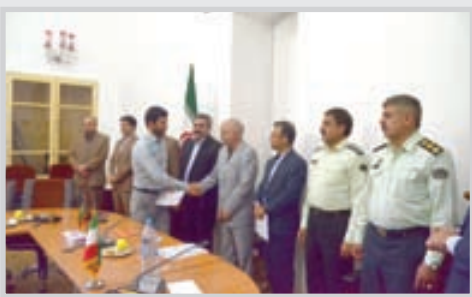
دولت به یک اصل تبدیل شده است، تصریح کرد: میراث فرهنگی

مدیر عامل انجمن حمایت از زندانیان عنوان کرد: