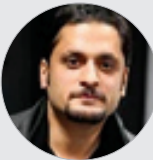
کارگردان نمایش «آلزیمر»:

وی تأکید می کند: شهرستان ها هنرمندان خوبی دارند، اما باید به دنبال تبادل بود تا تئاتر