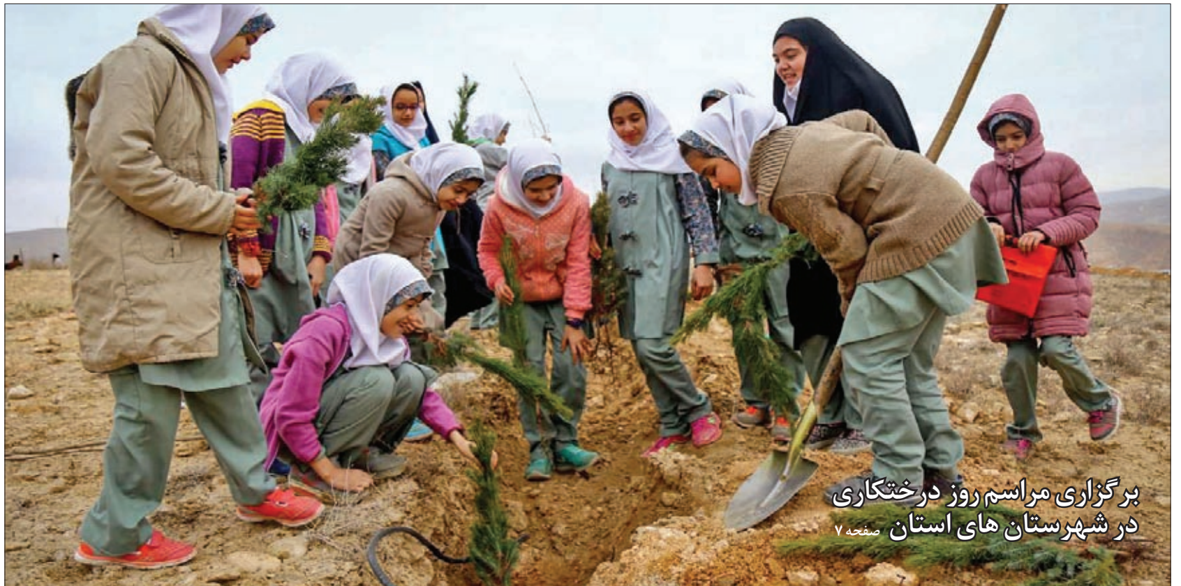
برگزاری مراسم روز درختکاری در شهرستان‌های استان صفحه ۷