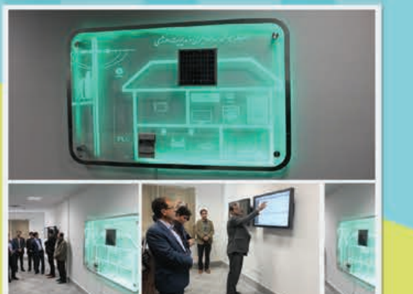
مرکز فهایم شرکت توزیع نیروی برق استان خراسان شمالی

افزایش ایمنی، حفظ محیط زیست، جلوگیری از آتش‌سوزی غیر مجاز نیز از مزایای این طرح است.