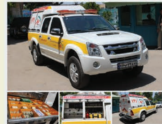
سامانه ۵سین مراکز فوریت های برق استان خراسان شمالی

آزادی، امنیت، رفاه و پیشرفت برای ایرانیان