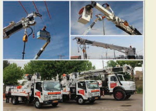
سامانه خط گرم فرمان از نزدیک استان خراسان شمالی

شرکت توزیع نیروی برق استان خراسان شمالی به منظور کاهش خاموشی های با برنامه در زمان سرویس و نگهداری شبکه های توزیع و ارتقاء سطح خدمات فنی شرکت به خریداری اولین لاین تراک تولید داخل و دو دستگاه بالابر بوم عایق و راه اندازی سامانه خط گرم فرمان از نزدیک فشار متوسط در سطح واحدهای تابعه شرکت مبادرت کرده است و با به کارگیری دو شرکت پیمانکار خط گرم، کلیه فعالیت های سرویس و نگهداری خطوط فشار متوسط و پست ها را به صورت گرم (بدون اعمال خاموشی) انجام می دهد.