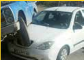
تصادف ۲ خودرو در بلوار ولایت