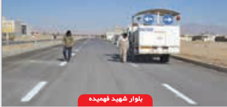
بلوار شهید فهمیده