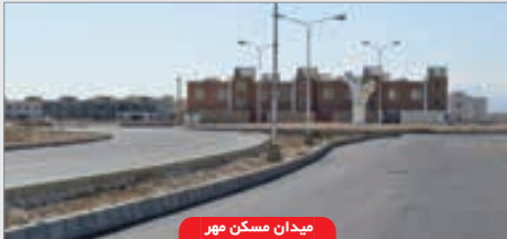
میدان مسکن مهر