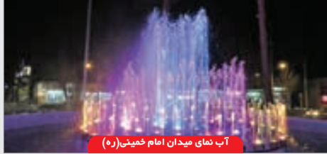
آب نمای میدان امام خمینی(ره)