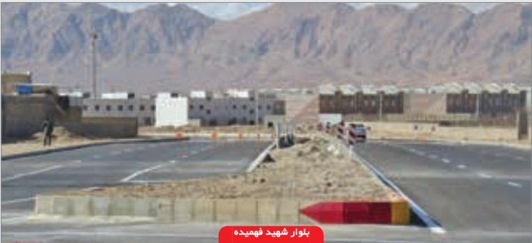
بلوار شهید فهمیده

■ مهم ترین پروژه های شهرداری در دهه فجر شهردار جاجرم با اشاره به مهم ترین پروژه های به بهره برداری رسیده در دهه فجر افزود: از جمله پروژه های مهم شهرداری که در دهه فجر به