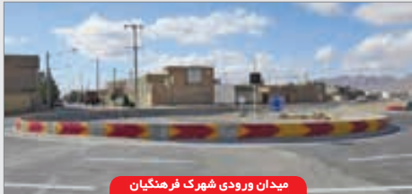
میدان ورودی شهرک فرهنگیان