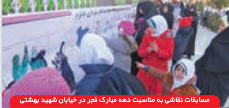
مسابقات نقاشی به مناسبت دهه مبارک فجر در خیابان شهید بهشتی