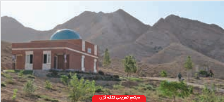
مجمع تفریحی تنگه گزی

■ راهکارها برای بازسازی واحیای بافت فرسوده شهردار جاجرم با بیان راهکارهایی که می توان برای بازسازی واحیای بافت فرسوده برای مقابله با بحران انجام داد، تصریح کرد: ساماندهی معابر و بازگشایی موانع عبور در بافت های فرسوده با هدف امکان تردد خودروهای امدادی و اورژانس ومقاوم سازی ساختمان ها و توجه به جنبه های انسانی در بافت های فرسوده و طبقه بندی کردن مناطق از نظر میزان خطرپذیری که از عوامل مهم برای کاهش تلفات انسانی ومادی در هنگام وقوع زلزله است از جمله این راهکارهاست. ■ اقدامات انجام شده برای احیای بافت فرسوده «پهلوان» ابراز کرد: شهرداری در راستای مقاوم سازی و