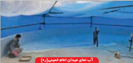
آب نمای میدان امام خمینی(ره)

۶۶ مهندس «پهلوان»: ۷۹ هکتار از مساحت شهر را بافت فرسوده شهری تشکیل داده است که می توان با مقاوم سازی آن ها باعث کاهش اثر بحران و حفظ موثر بافت تاریخی آن شد