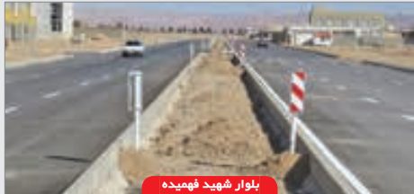
بلوار شهید فهمیده