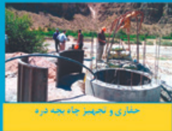
حفاری و تجهیز چاه بجه دره