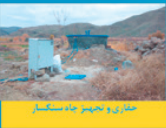
حفاری و تجهیز چاه سنگسار