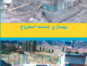
بهسازی چشمه اسفروچ