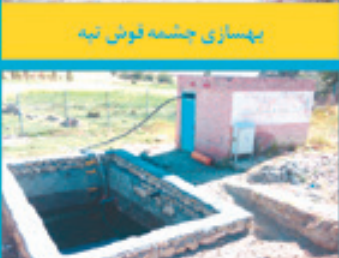
بهسازی چشمه قوش تپه