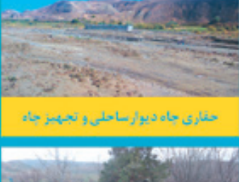
حفاری چاه دیوار ساحلی و تجهیز چاه