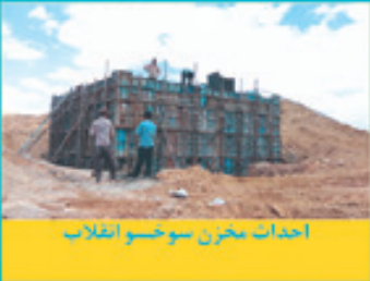
احداث مخزن سوخسو اضلابل