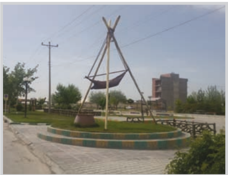
عکس:خراسان شمالی صنایع دستی متنوع و گوناگون، لباس ها و پوشش محلی از جمله مواردی است که می تواند دست ما به هنرمندان برای ساخت المان های زیبا شود

نقش کمرنگ المان های بومی در مبلمان شهری شیروان