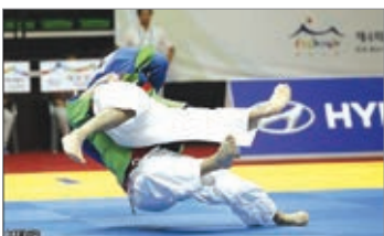
خراسان شمالی میزبان کوراش کاران آسیا

نجفیان- به مناسبت سالروز تأسیس استان، «خراسان شمالی» میزبان رقابت های کوراش جوانان آسیا خواهد بود.