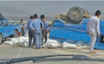
حادثه در قاپ

برخورد ۲ خودروی نیسان در محور بجنورد-آشخانه