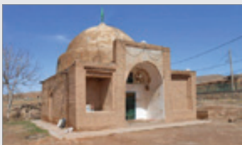
نخجیان- آرامگاه امامزاده محمد(ع) در روستای باغشجرد در بخش بام و صفی آباد شهرستان اسفراین واقع و بنای آن با پلان یک ایوانی ساخته شده است و گنبدخانه آن ۴ در ورودی دارد. در نمای داخلی بنا نقوش گل و بوته ترسیم شده و کتیبه هایی با متن آیت الکرسی دیوارهای داخلی را مزین کرده است. این بقعه در دوره صفویه بر مرقد یکی از فرزندان امام موسی کاظم(ع) ساخته شده و به شماره ۵۹۵۰ در فهرست آثار ملی به ثبت رسیده است. در سال های اخیر برای احیا و مرمت این بقعه متبر که ۹۰۰ میلیون ریال هزینه شده است.