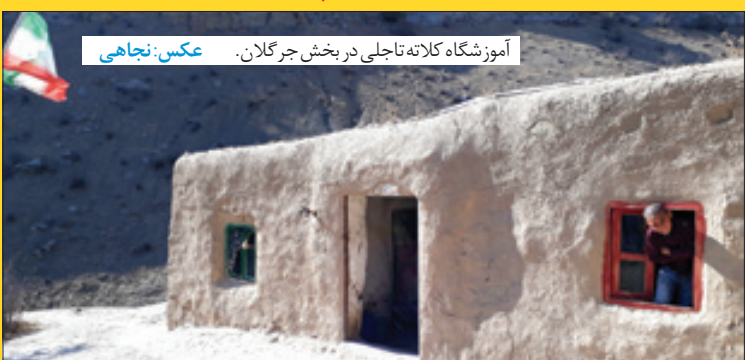
آموزشگاه کلاته تاجلی در بخش جرجان.