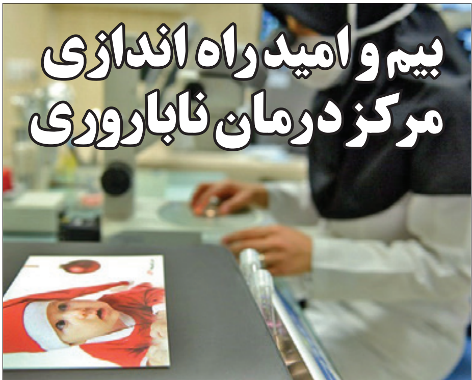
۷ سال اول

گروه اجتماعی – حسادت واکنشی هیجانی است که از حدود دو سالگی آغاز می شود و با رشد کودک، ممکن است تا بزرگسالی ادامه یابد. حسود فردی است که از شادکامی، موفقیت و پیشرفت دیگران در حیطه های مالی، تحصیلی و شغلی ناراحت می شود. حسادت در نهایت به ناتوانی و احساس کمبود در شخص حسود تبدیل می شود و او را دچار خقارت می کند. حسود آرزوی زوال نعمت دیگران را می کند اگرچه شاید خودش هم آن نعمت را داشته باشد و به طور معمول سعی می کند با بی اعتنائی و انتقاد از رقیب، او را از صحنه بپرو و موقعیت خودش را تثبیت کند. بیشتر افراد منفی باف از این دسته هستند. در واقع بیشترین مشکل افراد حسود این است که مفروضات مباهله آمیزی را درباره زندگی و شرایط دیگران می سازند، خوبی ها و شادکامی های آنان را بزرگ می بینند و مشکلات و سختی های زندگی آن ها را نادیده می گیرند.