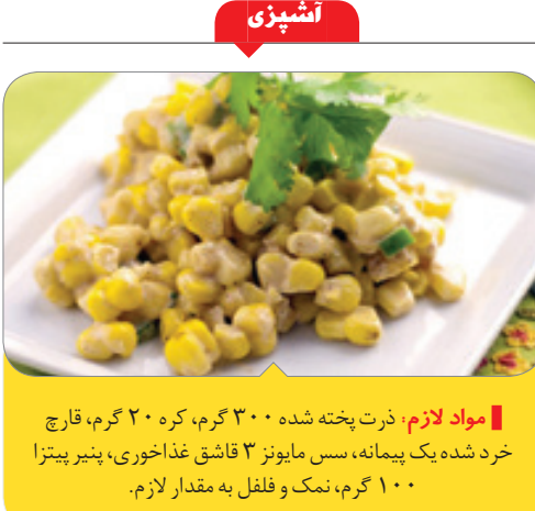
مواد لازم: ذرت پخته شده ۳۰۰ گرم، کره ۲۰۰ گرم، قارچ خرد شده یک پیما، سس مایونز ۳ قاشق غذاخوری، پنیر پیتزا ۱۰۰ گرم، نمک و فلفل به مقدار لازم.

یکی از شهروندان که فرزندی به مدت ۸ سال زایایی داشت، بیان می کند: سال‌ها با هزینه های سنگین و با صرف هزینه های زیاد و با گرفتن و شغلی تراحت می شود. حسادت در نهایت به ناتوانی و احساس کمبود در شخص حسود تبدیل می شود و او را دچار خقارت می کند. حسود آرزوی زوال نعمت دیگران را می کند اگرچه شاید خودش هم آن نعمت را داشته باشد و به طور معمول سعی می کند با بی اعتنائی و انتقاد از رقیب، او را از صحنه بپرو و موقعیت خودش را تثبیت کند. بیشتر افراد منفی باف از این دسته هستند. در واقع بیشترین مشکل افراد حسود این است که مفروضات مباهله آمیزی را درباره زندگی و شرایط دیگران می سازند، خوبی ها و شادکامی های آنان را بزرگ می بینند و مشکلات و سختی های زندگی آن ها را نادیده می گیرند.