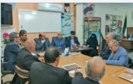
آخرین جلسه مجمع عمومی اتاق اصناف شیروان در سال ۱۳۹۷، با حضور جناب آقای دکتر مرآت فرماندار محترم شیروان و جناب آقای مجیدی رئیس اداره صمت.