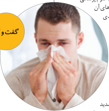
گفت و گو

کند و زمانی که کودک در مواقع دیگر هم بنا به تشخیص