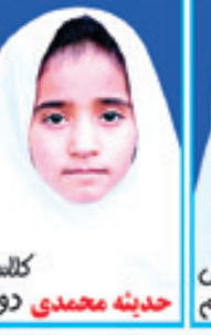
کلاس حدیثه محمدی دوم