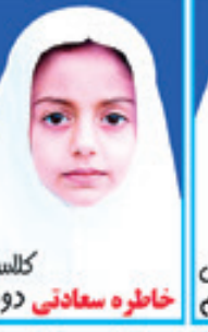
کلاس خاطره سعادت دوم