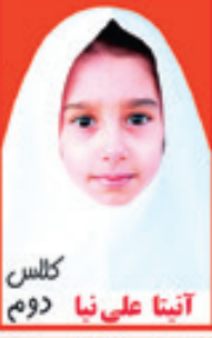
کلاس آیتنا علی نیا دوم