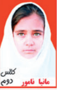
کلاس مانیا نامور دوم