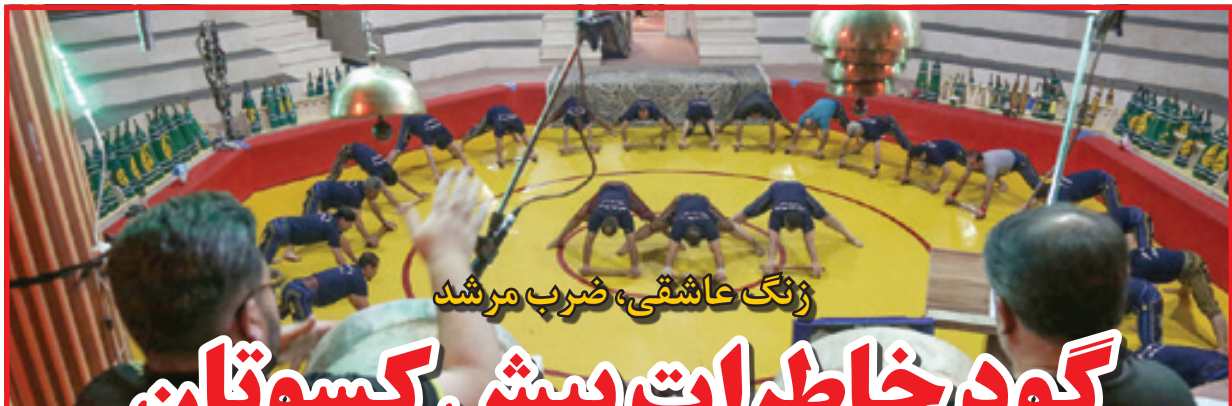
زنگ عاشقی، ضرب مرشد