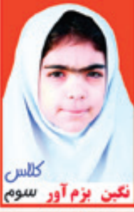
کلاس نگین بزم آور سوم