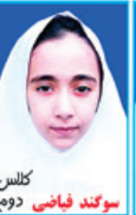
کلاس سوکل فیاضی دوم