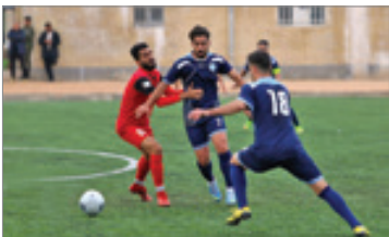
اترک آماده نیم فصل دوم