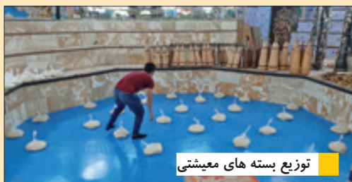
توزیع بسته های معیشتی