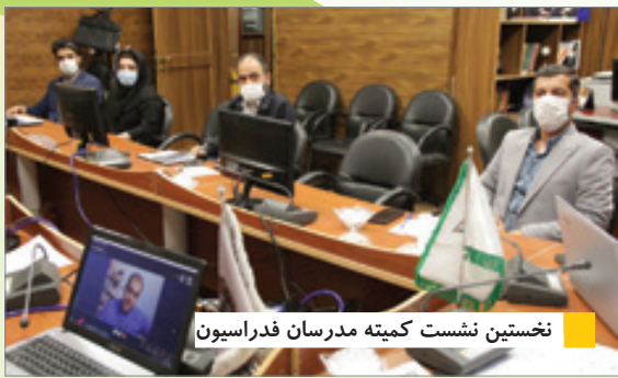
نخستین نشست کمیته مدرسان فدراسیون

دبیر هیئت ورزش های زورخانه ای و کشتی پهلوانی نیز از افتتاح پروژه های گود زورخانه آبخانه، شیروان و صفی آباد خبر می دهد. به گفته «طیعی» هم اکنون ۹۰ درصد این پروژه ها به اتمام رسیده است. او به پیشرفت ۳۰ درصدی گود های جاجرم و راز و جرجلان نیز اشاره می کند. به گفته او فاروج، شیروان، اسفراین و گرمه دارای یک گود باستانی هستند، بخیرود ۳ گود باستانی دارد و گود سایر شهرستان ها نیز به زودی افتتاح خواهد شد.