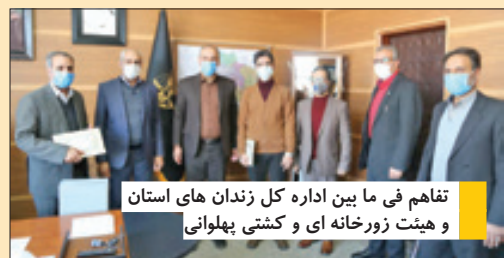
تفاهم فی ما بین اداره کل زندان های استان و هیئت زورخانه ای و کشتی پهلوانی