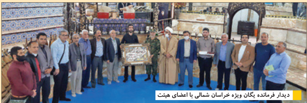
دیدار فرمانده یگان ویژه خراسان شمالی با اعضای هیئت