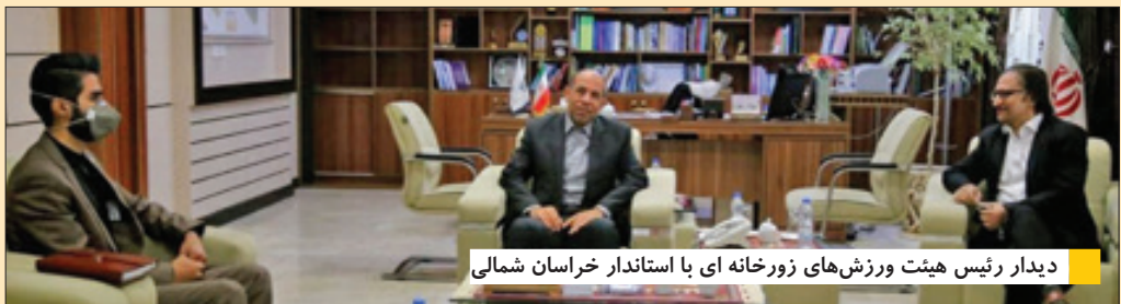
دیدار رئیس هیئت ورزش های زورخانه ای با استاندار خراسان شمالی