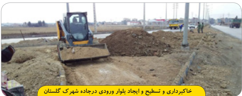
خاکبرداری و تسطیح و ایجاد بلوار ورودی درجاده شهرک گلستان با کاشت ۲۰۰۰ نهال چنار و زیباسازی شهر