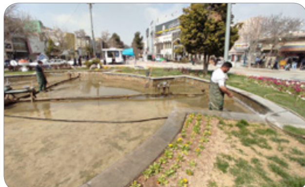
آبگیری استخر میدان شهید - ۲۹ اسفند