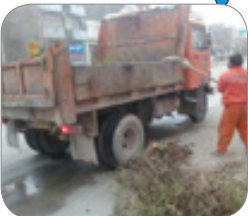
نخاله برداری و تسطیح و نظافت اراضی و معابر شهری