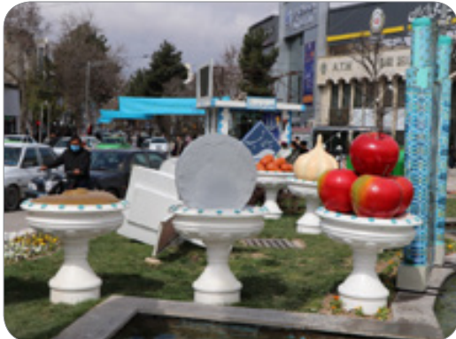
گزارش تصویری از سیما منظر شهری