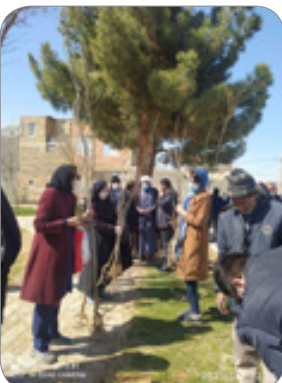
پوشش شهروندان در توزیع رایگان نهال