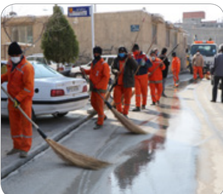
نارنجی - رنگ خوش خدمت در شهرداری - عکس یادگاری درپوش خدمت و ثبت آخرین دقایق سال ۱۳۹۹