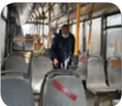
ضد عفونی و فاصله گذاری در ناوگان حمل و نقل عمومی