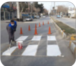
خط کشی و نصب علائم ترافیکی و تعویض سرعت گیر در ارتفاعات سطح ایمنی در بلوارها