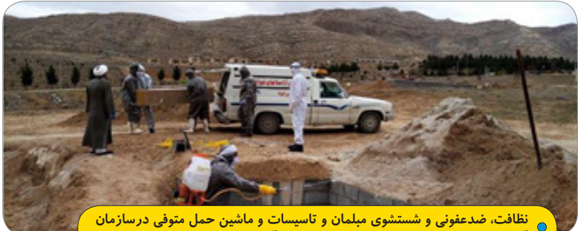
نظافت، ضد عفونی و شستشوی میلمان و تاسیسات و ماشین حمل متوفی در سازمان آرامستان با تمرکز بر استمرار خدمات و توسعه آن در آستانه نوروز