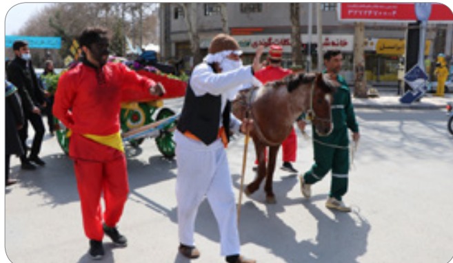
راه اندازی کارناوال نوروزی با هدف نشاط اجتماعی