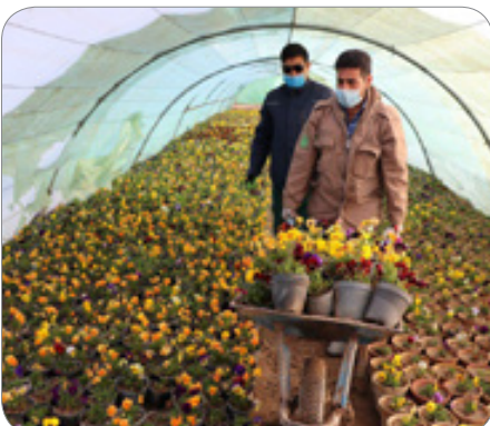
کاشت کلهای نوروزی در معابر شهر