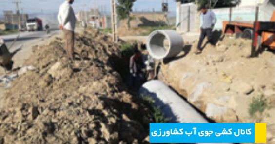
کانال کشی جوی آب کشاورزی