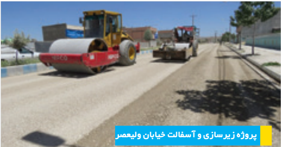
پروژه زیرسازی و آسفالت خیابان ولیعصر