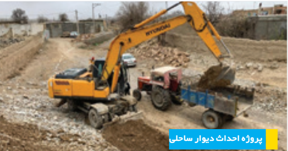
پروژه احداث دیوار ساحلی