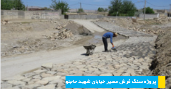
پروژه سنگ فرش مسیر خیابان شهید حاجلو