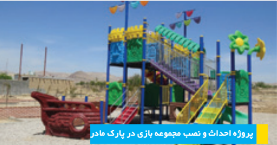
پروژه احداث و نصب مجموعه بازی در پارک مادر