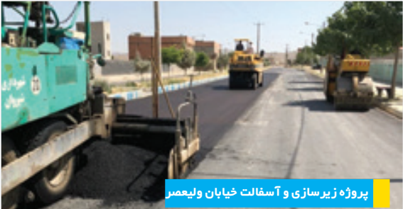
پروژه زیرسازی و آسفالت خیابان ولیعصر