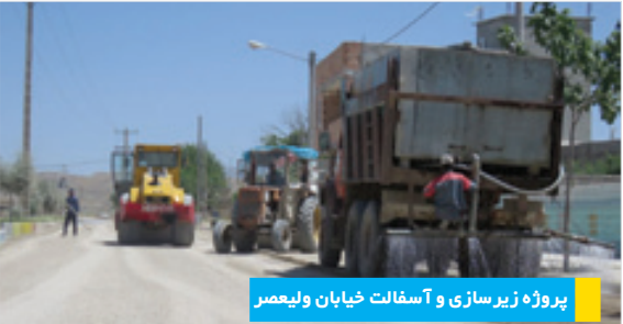
پروژه زیرسازی و آسفالت خیابان ولیعصر