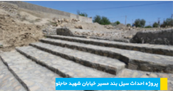
پروژه احداث سیل بند مسیر خیابان شهید حاجلو