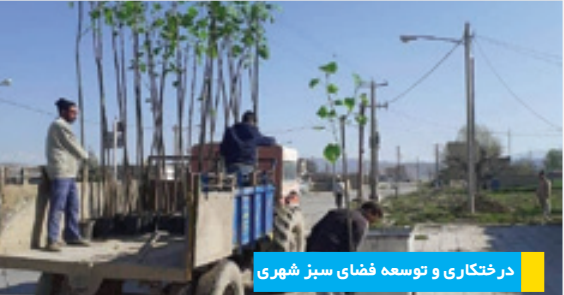
درختکاری و توسعه فضای سبز شهری