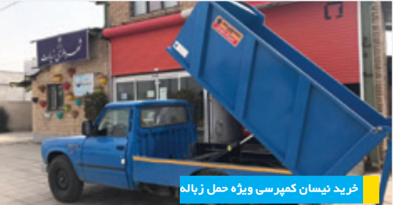
خرید نیسان کمپرسی ویژه حمل زباله