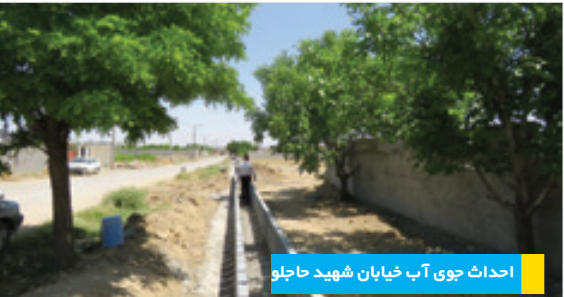
احداث جوی آب خیابان شهید حاجلو