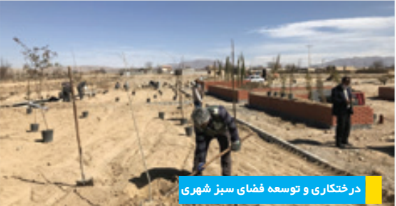
درختکاری و توسعه فضای سبز شهری