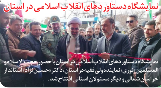
نمایشگاه دستاوردهای انقلاب اسلامی در استان با حضور حجت الاسلام والمسلمین نوری، نماینده ولی فقیه در استان، دکتر حسین نژاد، استاندار خراسان شمالی و دیگر مسئولان استانی افتتاح شد.

افتتاح و کلنگ زنی ده ها پروژه در شیروان و فاروج