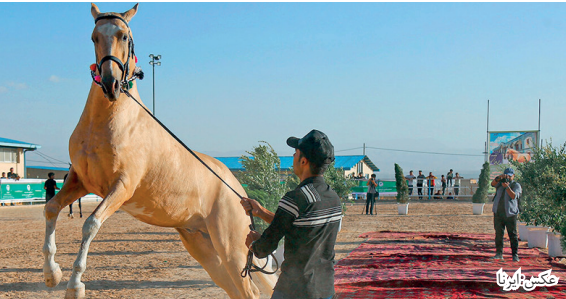
یکشنبه ۱۳ خرداد ۱۴۰۲