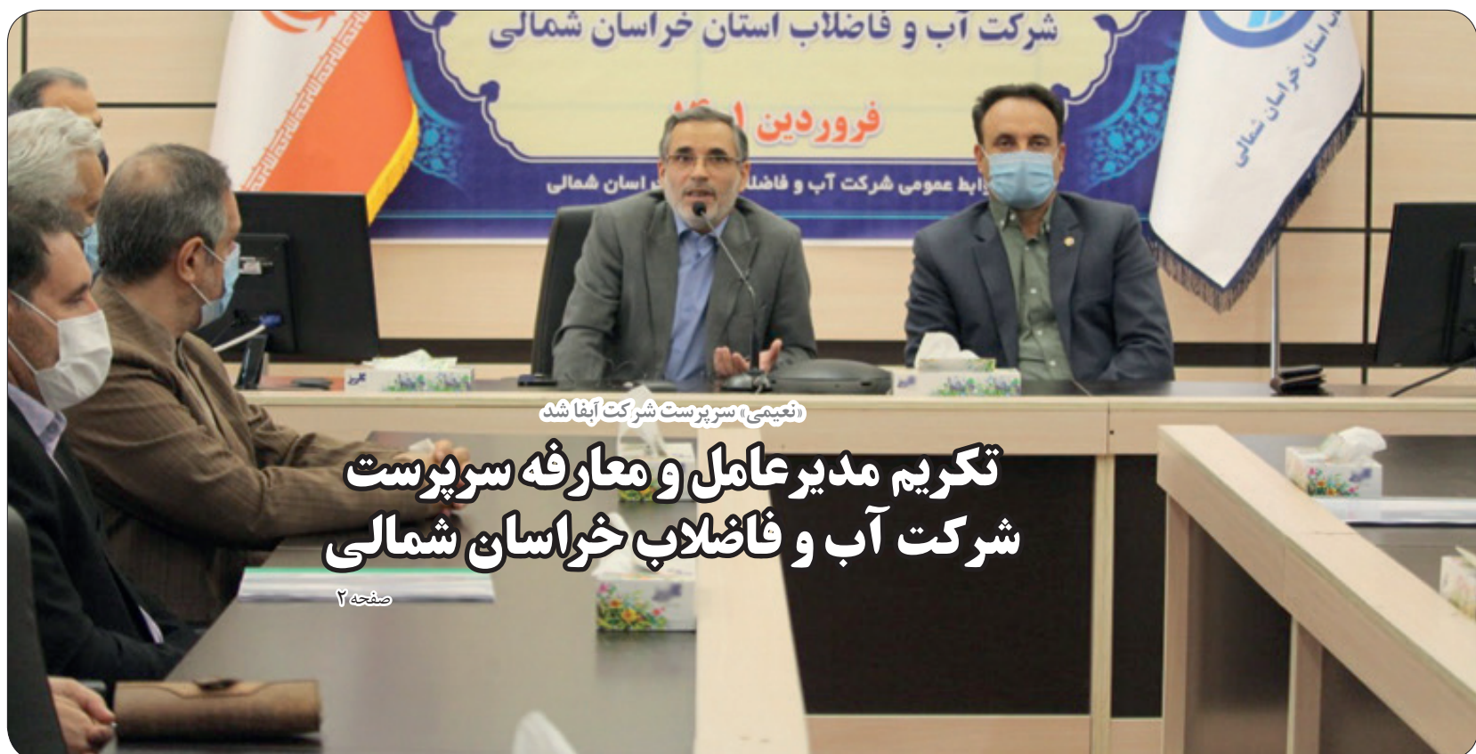
(نیمه) سرپرست شرکت آبفا شد